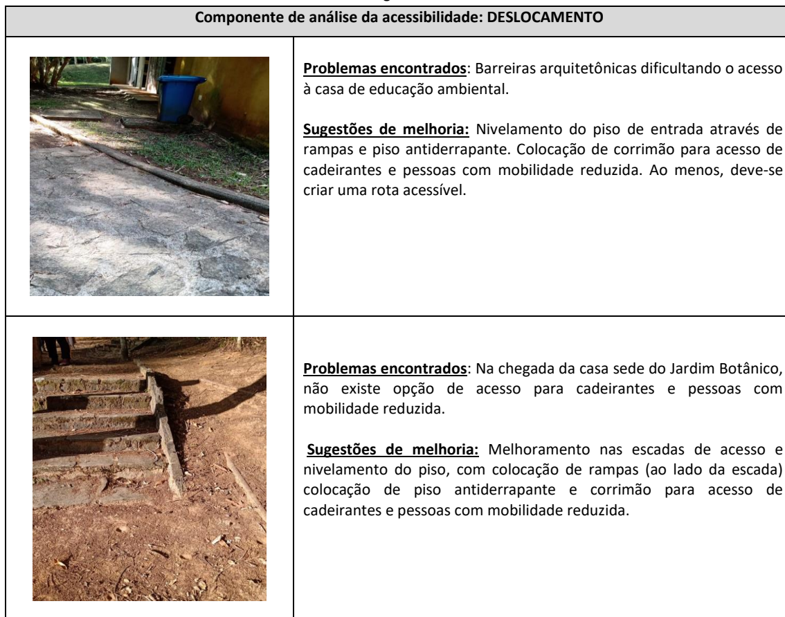
Quadro 3: Parecer ergonômico: deslocamento