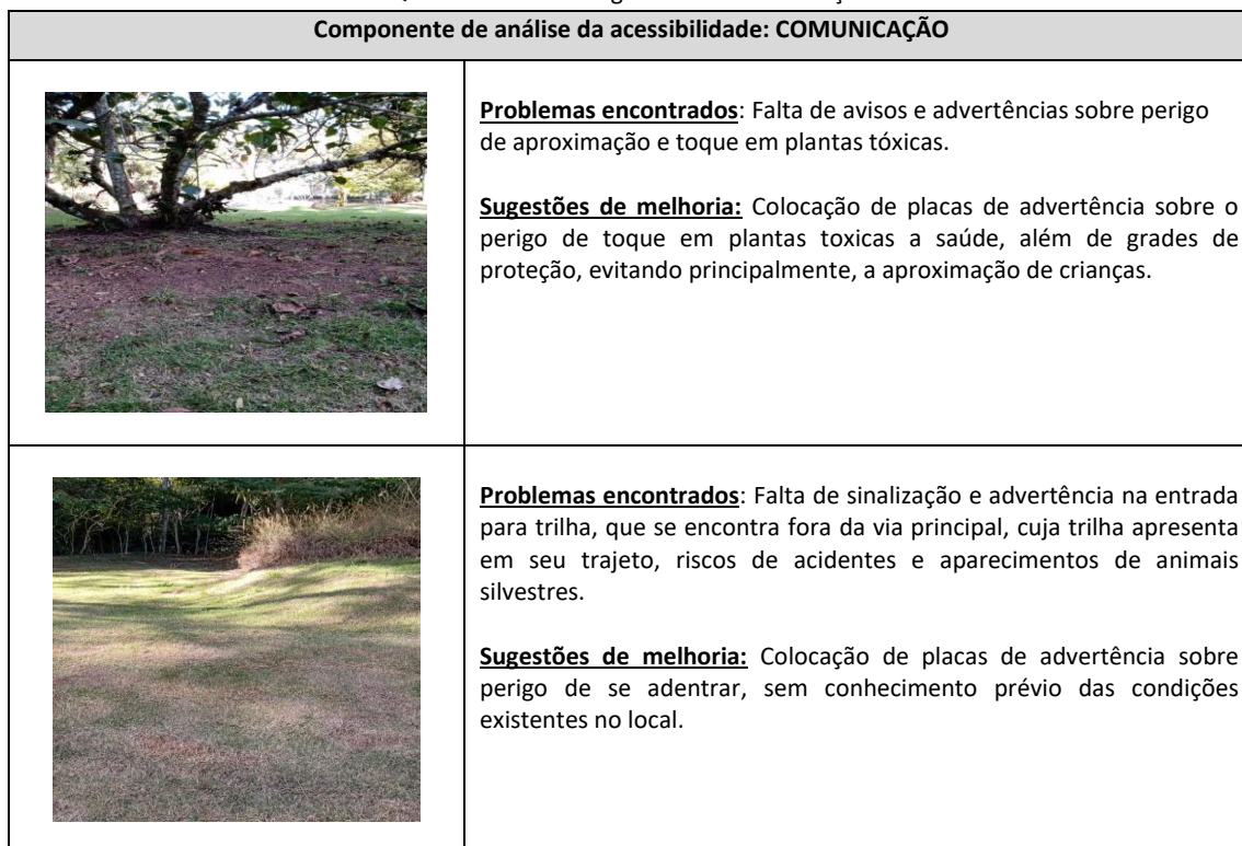
Quadro 4: Parecer ergonômico: comunicação