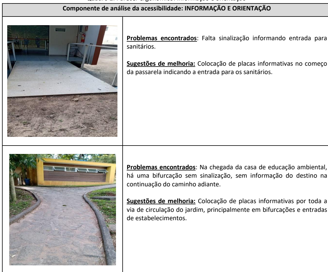
Quadro 2: Parecer ergonômico: informação e orientação

Cabe ressaltar que a maioria das imagens apresenta mais de um componente que restringe a acessibilidade no local, como, por exemplo, falta de sinalização e falta de rampas ou corrimãos. Mas, para efeito de menção neste artigo, priorizou-se um dos componentes, de tal forma a evidenciar, mais facilmente, o problema identificado e a solução proposta para cada uma das categorias analíticas.