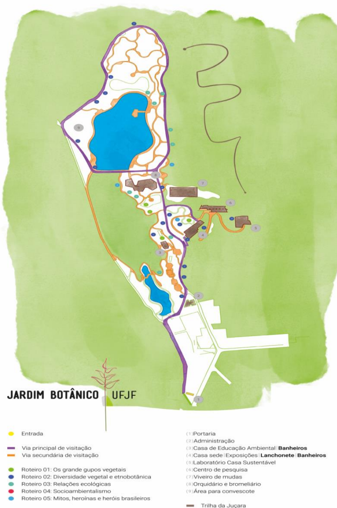
Figura 1 – Mapa ilustrativo do Jardim Botânico de Juiz de Fora/MG