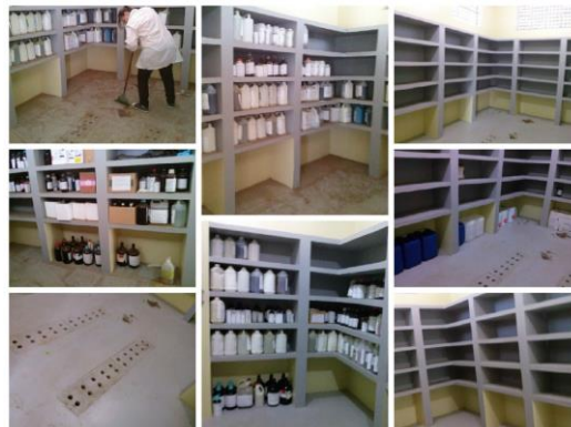
Figura 5. Entreposto de Armazenamento de Resíduos Químicos do IBILCE/UNESP antes e depois da limpeza no mês de julho de 2015.

Com a retirada de grande parte dos resíduos estocados, ainda havia uma grande quantidade que necessitava ser disposta adequadamente, então no mês de julho de 2015 executou-se a limpeza a seco do entreposto, já que a quantidade de poeira era grande, o que poderia resultar em algum acidente. Na Figura 5 é possível comparar as mudanças no local antes e depois da limpeza.