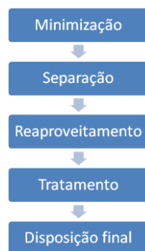
Figura 1. Fluxograma sobre a hierarquia de um Programa de Gerenciamento de Resíduos.

No campus de São José do Rio Preto, o gerenciamento dos resíduos químicos é realizado pela Comissão de Ética Ambiental (CEA) desde 2004 e tem como base, o Programa de Gerenciamento de Resíduos – PGR da UNESP 8 , instituído em agosto de 2006. Há a necessidade de trazer diretrizes básicas para a gestão e gerenciamento dos resíduos para uma unidade geradora (UG) 9 . Em termos organizacionais os passos de hierarquia para implementação de um programa de gerenciamento de resíduos é apresentado na Figura 1 .