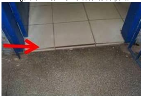
Figura 04: Desnível no batente da porta

Em relação à análise feita dentro das edificações quanto as Rampas de acesso interno e Desnível, apenas três prédios atendiam aos itens 6.5 e 6.3.4 da NBR 9050/2015 (ABNT, 2015), respectivamente. De acordo com as observações realizadas, nos 6 demais prédios, as rampas se encontraram danificadas e não possuíam sinalização tátil e visual no piso, estando em desacordo com o que exige os itens 6.3.2 e 5.4.6 da NBR 9050/2015 (ABNT, 2015), respectivamente. Além de que os corrimãos não atendiam ao item 6.9.2.1 da NBR 9050/2015 (2015) e as portas de acesso às salas e recepção, conforme mostra a figura 04, possuíam desníveis superior ao que permite o item 6.3.4.1 da NBR 9050/2015 (ABNT, 2015).