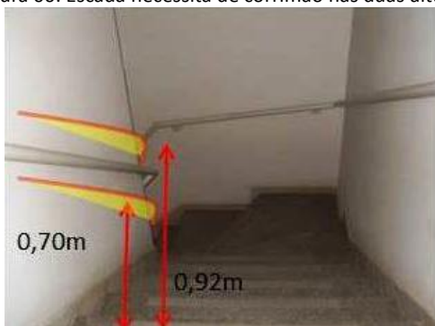
Figura 06: Escada necessita de corrimão nas duas alturas.

Com relação à Escada interna, apenas o prédio 01 possuía primeiro pavimento e não apresentou corrimãos nas duas alturas, como mostra a figura 06, sinalização tátil e circulação vertical de escada associada a uma rampa ou elevador, conforme exige os itens 6.9, 5.4.6 e 6.6 da NBR 9050/2015 (ABNT, 2015).