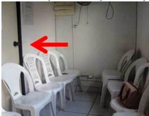
Figura 08: Puxador tipo bola e cadeiras plásticas inadequados

Na análise referente ao item Portas Internas, apenas o prédio 01 atendeu às exigências da NBR 9050/2015 (ABNT, 2015). Os demais prédios necessitam ampliar o vão de entrada para as salas para 0,80 m, instalar puxador horizontal na porta de entrada e mudar a maçaneta por tipo alavanca, conforme mostra a figura 08, a fim de atender os itens 7.11.5, 6.11.2.7 e 6.11.2 da NBR 9050/2015 (ABNT, 2015), respectivamente.