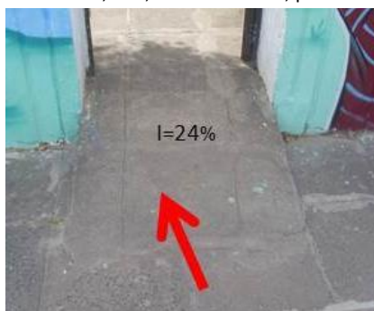
Figura 02: Rampa com inclinação acima de 8,33%, sem corrimãos, piso tátil e ocupa parte da calçada externa.

Em relação ao item Portas e rampa de acesso externo, apenas dois prédios atenderam aos requisitos solicitados pela norma vigente, os demais possuíam vão livre das portas menores que 0,80 m e as rampas com inclinação superior a 8,33% em descordo com os itens 6.11.2 e 6.5 da NBR 9050/2015, respectivamente, conforme mostra a figura 02.