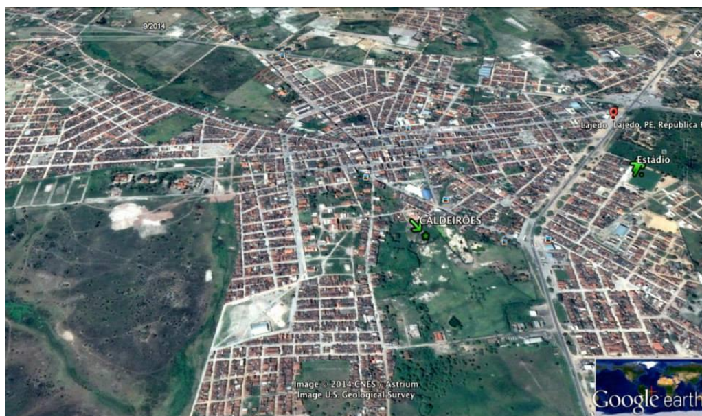
Figura 2: Imagem dos Caldeirões na área Central de Lajedo/PE

Essa formação rochosa conta com uma área de, aproximadamente, 1.3 hectares referentes à rocha principal situada em propriedade da prefeitura municipal. Outra área, no entanto, apresenta, aproximadamente 1.8 hectares localizando-se em propriedade pública, mas de outra ordem ainda não totalmente definida se federal, estadual ou municipal. E, existe, também, uma área maior estimada em 10 hectares situada em propriedade privada, cuja principal atividade econômica é a produção de gado leiteiro.