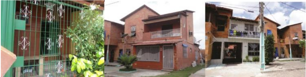
Figura 4: Imagens do “Puxado”, adaptado pelos próprios moradores dos sobrados.

Trabalho Inscrito na Categoria de Artigo Completo