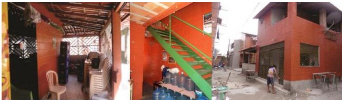
Figura 3: Casas do conjunto Habitacional Vila da Barca com adaptações

Morador 2: - “Disseram que a família que morava com 2 ou 3 famílias na mesma casa, não ia ter problema, que cada família ia receber sua casa. Eu fiz o cadastro, meu filho fez o cadastro, minha filha fez o cadastro e não sei porque os meus filhos não pegaram a casa deles, eu fiquei com um sentimento tão forte porque eles não conseguiram a casa deles. Lá também eu tinha um comércio e que aqui prometeram uma área pra gente vender quem tinha venda e até agora não fizeram nada e nem dão uma satisfação, e eu não posso esperar porque eu dependo também desse comércio que eu vendia tudo, como não me deram eu tô vendendo água mineral mesmo aqui na minha sala”.