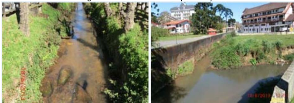
Figura 2: Ponto de coleta no Rio Sapucaí-Guaçu