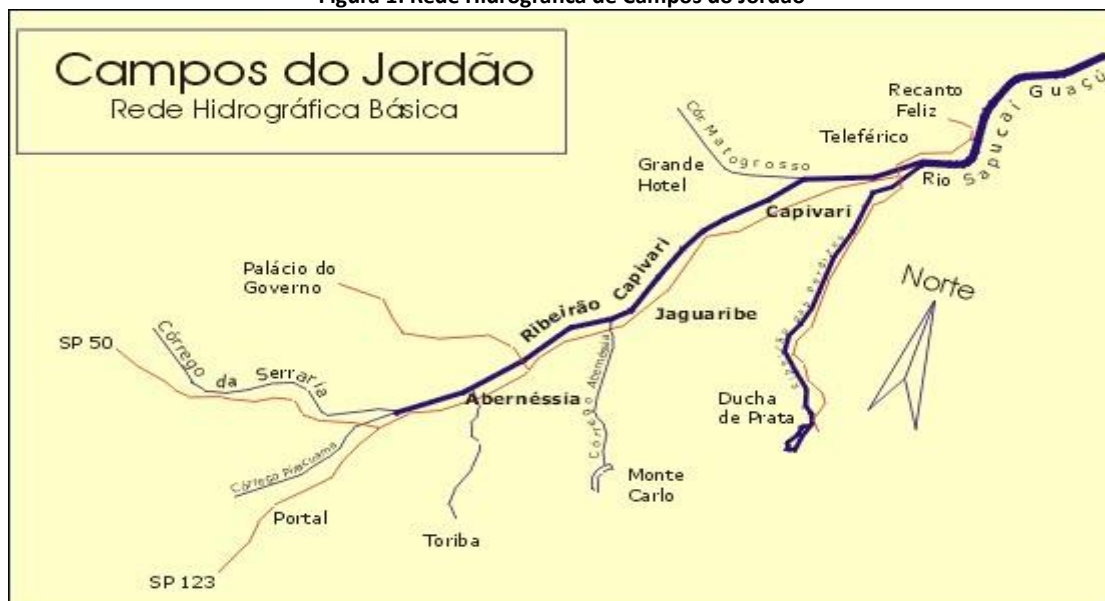
Figura 1: Rede Hidrográfica de Campos do Jordão