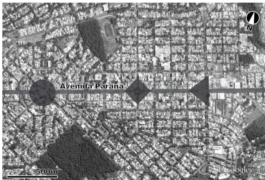
Figura 1: Eixo viário da Av. Paraná com indicação das praças Miguel Rossafa, Arthur Thomas e Santos Dumont

Legenda: ◄ Pça. Miguel Rossafa ◆ Pça. Arthur Thomas ● Pça. Santos Dumont