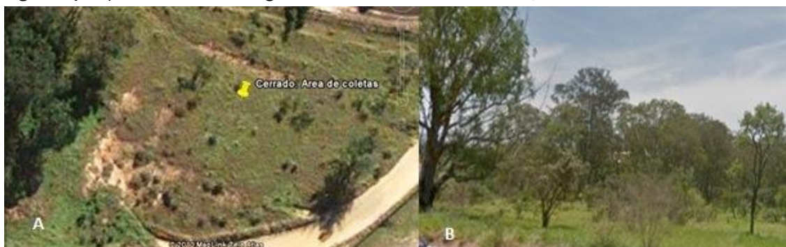
Figura 1(A-B) Vista aérea do fragmento de Cerrado de Botucatu/ SP

O Fragmento de cerrado está localizado na cidade de Botucatu, SP ( 48^{\circ}27'22.44''\text{O} e 22^{\circ}55'36.33''\text{S} ) em uma área de proteção ambiental onde se encontra as instalações da Escola do Meio Ambiente (EMA) instituição pertencente à Prefeitura municipal de Botucatu-SP, criada em 2005, através da Secretaria Municipal de Educação, para formação de educadores ambientais. A área de cerrado da escola ocorre em formas de manchas, sendo cercado com remanescentes de florestas estacional semidecidual, com arbustos pequenos e algumas árvores maiores, seu solo possui uma cobertura de 70% de grama braquiária (Figura 1).