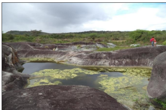
Figura 2- aspecto de uma marmita na horizontal

Observando essa outra imagem (Figura 2), percebemos que seu formato e tamanho são bem diferentes da imagem anterior, apesar de as duas marmitas se encontrarem no mesmo afloramento rochoso, suas diferenças são nítidas. Segundo Castro e Jatobá (2006, p.68) “É interessante lembrar que cada tipo de rocha tende a exibir no relevo uma determinada feição”.