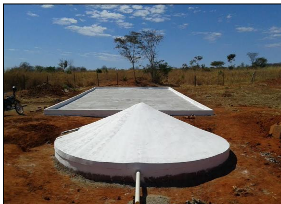
Figura 7: Cisterna calçadão