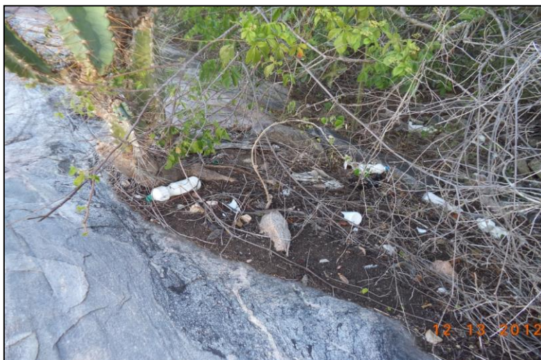
Figura 5- Resquícios de objetos usados nas praticas domésticas