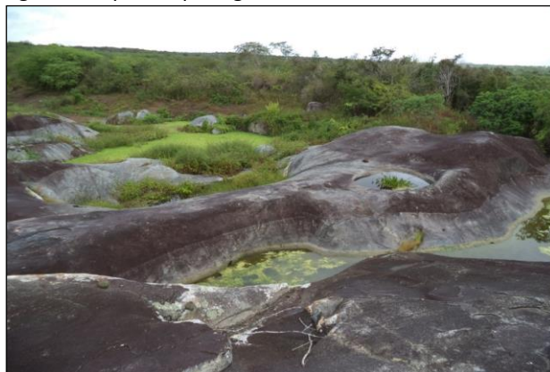
Figura 3- aspectos paisagísticos no entorno dos caldeirões

Devido à evaporação ser maior que a precipitação, o semiárido nordestino possui uma vegetação marcada por uma fisionomia singular a apresenta-se exuberante, durante a estação chuvosa, e rala e seca no período desfavorável, a qual é caracterizada pela a caatinga hipoxerófila formada por árvores e arbustos que perdem as folhas durante a seca, e só as recuperam quando volta a chover. Nesse contexto Ab’ Saber (2003, p. 85) comenta que: "E, de repente, quando chegam as primeiras chuvas, árvores e arbustos de folhas miúdas e múltiplos espinhos protetores entremeados por cactáceas empoeiradas, tudo enverdece". A vegetação encontrada nos arredores dos caldeirões rochosos de Ibirajuba é a caatinga hipoxerófila arbórea, das muitas plantas encontradas nessas áreas, destacam-se as juremas, macambira, algaroba, facheiro entre outros, que são usados também como complemento alimentar para os animais. Observa-se na foto abaixo a vegetação durante os períodos de chuvosos.