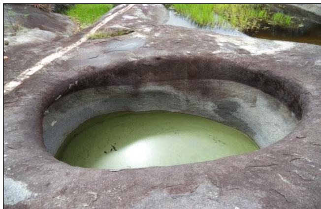
Figura 1- aspecto de uma marmita arredondada

Em meio à vegetação de caatinga encontram-se alguns afloramentos rochosos denominados de marmitas ou caldeirões, que são concavidades em diferentes formatos e tamanhos encravados nas rochas como vemos na figura 1. Nela podemos perceber o formato arredondado da marmita que é parecido com um caldeirão, é daí que surge sua denominação como é popularmente conhecido na região.