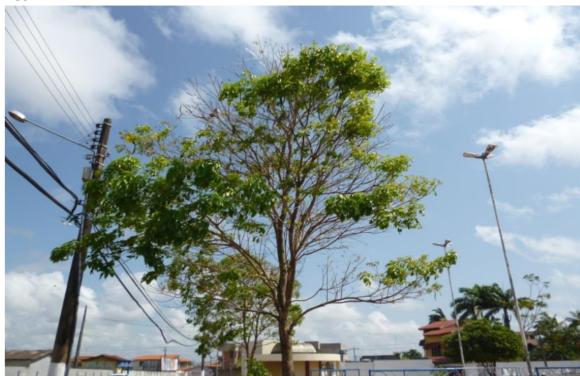
FIGURA 2: Espécie Tabebuia sp. plantada em local inadequado cuja copa interfere a fiação elétrica pública.

Diante disso, no presente trabalho fez-se uma avaliação quantitativa das árvores que interferem na fiação elétrica, como pode ser observar na figura 3, dos 28 indivíduos levantados, 10 árvores interferem na fiação elétrica, e 18 árvores não interferem, demonstrando a falta de um melhor planejamento das espécies a serem plantadas próximas a fiação.