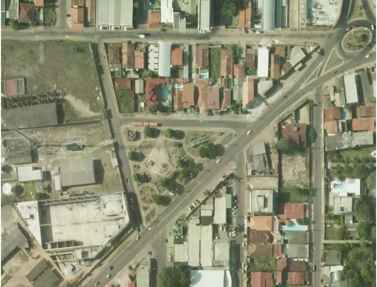
Figura 1: Delimitação da área de estudo, Praça Marco Zero, Macapá, Amapá.

Fonte: COT/Instituto de Pesquisas Científicas e Tecnológicas do Amapá (2016).