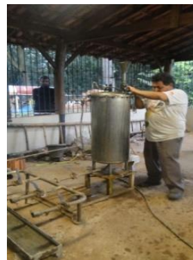
Figura 8: Adição de pressão na solução preservativa do processo de Boucherie modificado.