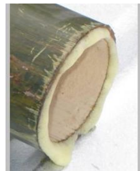
Figura 10: Agente preservativo passado sob pressão por meio dos vasos condutores.