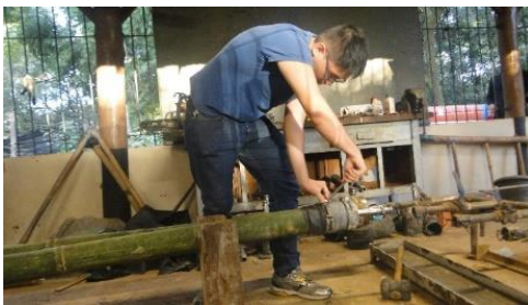
Figura 7: Preparo dos colmos para o método de Boucherie modificado.

Trabalho Inscrito na Categoria de Resumo Expandido