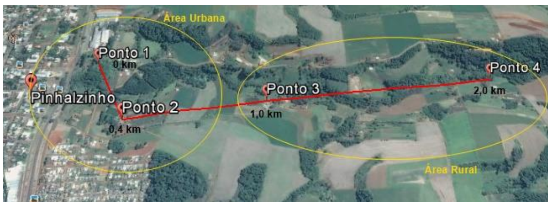
Figura 2: Pontos de coleta Rio Limeira