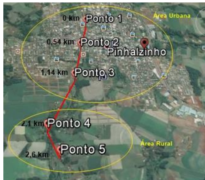
Figura 1: Pontos de coleta Rio Lajeado Bonito

Foram realizadas coletas a cada dois meses para cada rio. No rio Lajeado Bonito, foram definidos 5 pontos de coleta, sendo 3 urbanos e 2 rurais. Este rio possui sua nascente na área urbana seguindo para o perímetro rural.