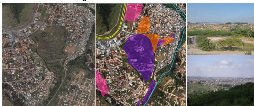
Figura 5 – Área C - Lixão da Pirelli

CETESB indeferiu o empreendimento, autuou-o e determinou à Concima a isolar a área, paralisar as obras de terraplenagem, interromper a venda de apartamentos, avaliar a qualidade da água subterrânea e os níveis de explosividade destes compostos. Em setembro de 2002 (PMC, 2016), a Prefeitura suspendeu a expedição de permissões ou autorizações no movimento de terra; muro de arrimo; edificação nova; demolição total; reforma; reconstrução; poço freático ou profundo na área. E ainda, qualquer utilização de águas com alguma ligação com o lençol freático, tais como fontes, poços, rios, córregos, ou nascentes, devem ser aferidas. E apesar de todas estas obrigações, o processo tem sido marcado por extrema morosidade da Concima e dos gestores públicos, com grande impacto na economia popular, envolvendo famílias que compraram a prazo apartamentos que não foram executados.