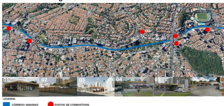
Figura 3- Área A – Postos de Combustíveis

LEGENDA: ■ CÓRREGO ANHUMAS ● POSTOS DE COMBUSTÍVEIS