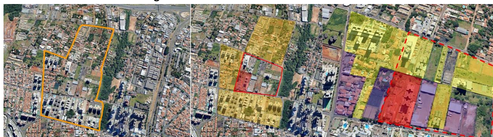
Figura 4 - Área B - Mansões Santo Antônio

A origem da contaminação ocorreu a partir de combustíveis e solventes armazenados em tanques subterrâneos advinda do número elevado de postos, idade avançada dos tanques; inviabilizando a utilização desses recursos naturais. Segundo Trovão (2006), num derramamento de gasolina a principal preocupação é a contaminação dos aquíferos e o manejo para o abastecimento de água para consumo humano, pois a gasolina comercializada no Brasil é misturada com álcool em proporções de 20 a 30%. As interações entre o etanol e água, podem causar um aumento da mobilidade e solubilidade, dificultando a biodegradação natural destes compostos. A questão da contaminação crescente do meio hídrico é importante, pois a legislação urbana não controla ou veta a localização dos Postos de Combustíveis, próximos às margens dos corpos d'água. Em Campinas existem aproximadamente 93 Postos de Combustíveis, com contaminação comprovada segundo a CETESB. A maioria destes postos foi construída entre a década de 1970 e 1980. A média de vida útil de tem sido de 25 anos para tanques subterrâneos, e a maioria, supõe-se já estejam comprometidos. (ANP: 2014) A questão das águas subterrâneas é fundamental, pois, conectam os aquíferos, águas superficiais e precipitações. Por isso, os problemas operacionais dos processos de remediação, para a resolução e o restauro da potabilidade do meio hídrico, exigem vários anos para serem atingidos, e a grande maioria não atinge remediação em níveis satisfatórios.