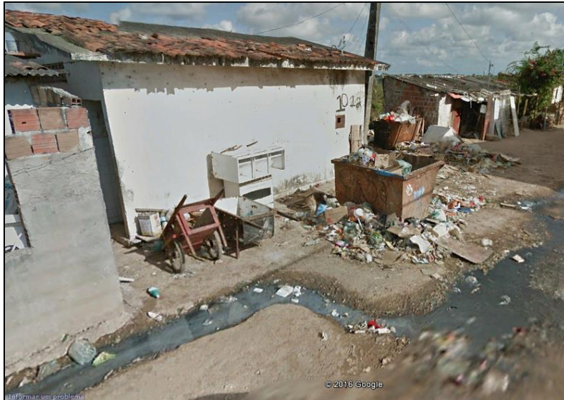
Figura 4: Despejo inadequado de resíduos e falta de rede coletora de esgoto.

Apesar disto, também é bastante comum no bairro, o acondicionamento de resíduos diretamente no solo, configurando focos de poluição urbana que impactam o meio ambiente e a paisagem (Figura 4), além também de se tornarem-se fontes de proliferação de insetos e vetores. No entanto, também deve-se observar que, o próprio chorume, líquido percolado resultante do processo de degradação dos resíduos ali deixados, também pode ser fator determinante para a contaminação do lençol freático, implicando na poluição ao longo do tempo da nascente ali existente.