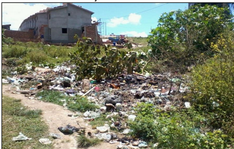
Figura 2: Despejo de Resíduos domésticos e da construção civil, próximo a Área de Preservação Permanente - APP.

De acordo com a Lei Nº 12.305/2010, os resíduos sólidos domiciliares, ou seja, resíduos provenientes de atividades domésticas em residências urbanas devem ser encaminhados para destinação adequada, seja esta no aproveitamento através de processos de reaproveitamento, reciclagem ou por fim, destinados ao aterro sanitário.