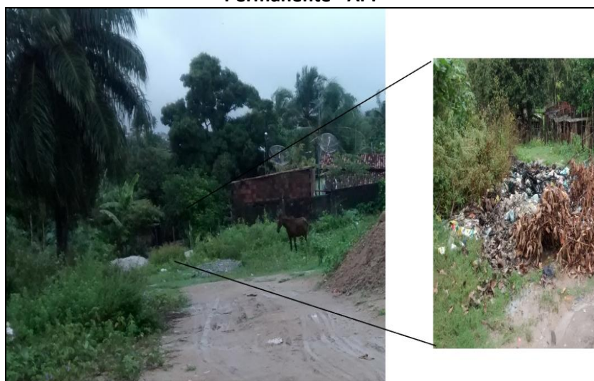
Figura 5: Despejo de diferentes tipos de resíduos próximo à Área de Preservação Permanente - APP

com que a população local e os animais que se encontram soltos possam transitar livremente por toda a área.