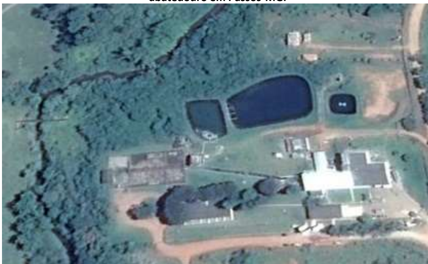
Figura 1. Imagem de satélite do sistema de tratamento de efluente (Lagoas de estabilização) do abatedouro em Passos-MG.

O estudo foi desenvolvido na estação de tratamento de efluentes, presente em um abatedouro bovino e suíno, situado no município de Passos, estado de Minas Gerais (Figura 1).