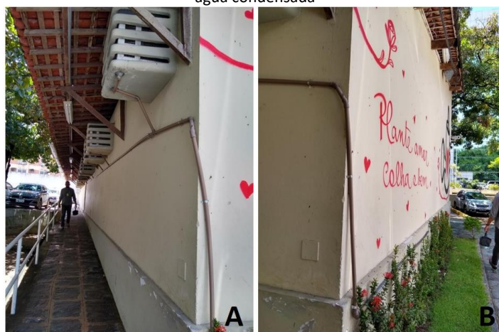
Figura 1 – (A) Sistema de coleta da água condensada da edificação térrea anexa; (B) Área ajardinada irrigada pela água condensada

anexa, a água condensada dos equipamentos de ar-condicionado é aproveitada para rega de uma pequena área ajardinada (Figura 1).