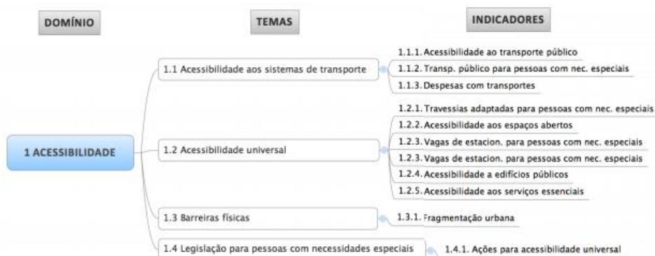
Figura 1 - Detalhe da estrutura hierárquica do domínio Acessibilidade - IMUS

Segundo a autora, a aplicação do índice permite identificar fatores críticos e fatores de maior impacto para a melhoria de aspectos globais e setoriais da mobilidade urbana, fornecendo subsídios para a proposição de políticas e estratégias visando melhorar a mobilidade urbana sustentável. A compatibilidade dos resultados obtidos segundo o cálculo dos indicadores e análise expedita feita por um especialista sugere que o IMUS fornece resultados confiáveis para o acompanhamento das condições de mobilidade urbana em cidades e médio e grande porte. A Figura 1 apresenta uma parte da estrutura hierárquica do IMUS, a partir do domínio Acessibilidade.