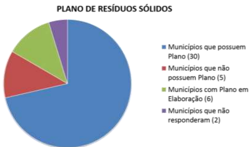
Gráfico 1.1: Representação dos municípios que possuem ou não o Plano de Resíduos Sólidos.

Tipo III: aquelas que estão com o Plano em elaboração: Brejo Alegre, General Salgado, Lourdes, Mirandópolis, Pereira Barreto e Suzanápolis.