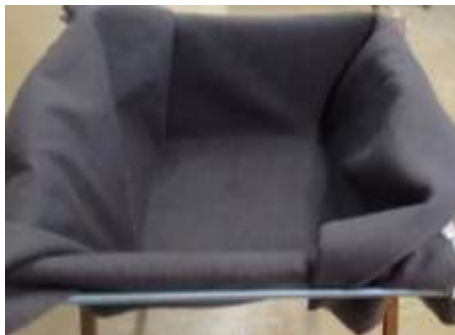
Figura 2: LD com manta geotêxtil aplicada, antes do início dos ensaios.