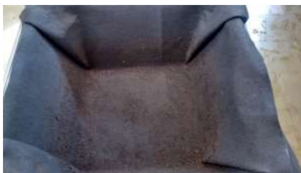
Figura 3: LD com manta geotêxtil suja após a remoção do lodo desaguado do ensaio anterior.

A brita foi novamente lavada e a manta considerada suja foi então recolocada no protótipo pronta para o início de um novo ensaio. É importante ressaltar que os experimentos com a manta suja (novo ciclo) não foram realizados no mesmo dia do término dos ensaios anteriores. A Figura 3 apresenta o aspecto da manta suja após remoção do lodo desaguado.