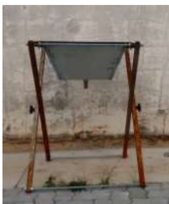
Figura 1: Protótipo de LD utilizado nos ensaios.

Em seguida, os protótipos do Leito de Drenagem foram preparados. O equipamento possui cerca de 1m de altura com área efetiva de fundo para drenagem pela manta geotêxtil de 0,35m x 0,35m. Sobre o leito de drenagem é disposta camada de brita lavada com cerca de 5cm que serve como suporte e então colocada a manta geotêxtil para realização dos ensaios. A Figura 1 apresenta o LD utilizado nos ensaios e a Figura 2 ilustra o protótipo com o geotêxtil aplicado e pronto para realização do ensaio.